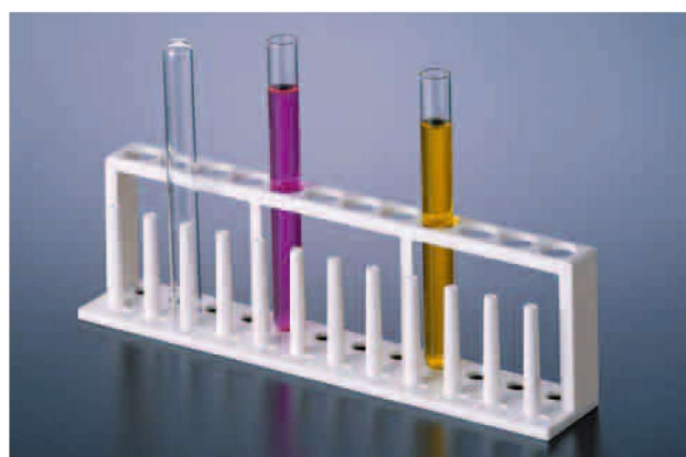
プラスチック棒付試験管台