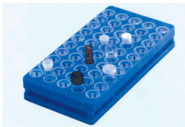
フレキシブルラック